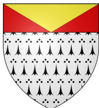
Blason des Mévouillon

La terre, qui était du fief des barons de Mévouillon, appartenait en 1259 aux Rosans, en 1334 aux Rican de l'Isle et dès 1347 aux Bésignan, dont les droits passèrent aux Morges. Ceux-ci, qui possédaient Eygaliers en 1379, furent remplacés par les Du Sauze, qui le vendirent en 1450 aux Alleman de Champ, lesquels le revendirent aux Chomart en 1459. Héritiers des Chomart vers 1640, les De Baux Ventaillac étaient encore seigneurs d'Eygaliers en 1789.